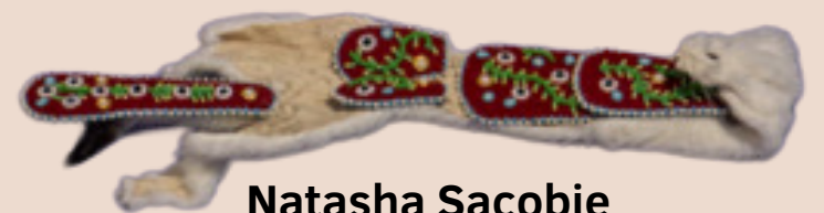
Natasha Sacobie Beaded Ermine Pelt- Back , 2023

Avant de découvrir les perles, les femmes autochtones utilisaient les objets qu'elles trouvaient dans la nature comme des coquillages, des os, du bois, du poil de caribou et des piquants de porc-épic.