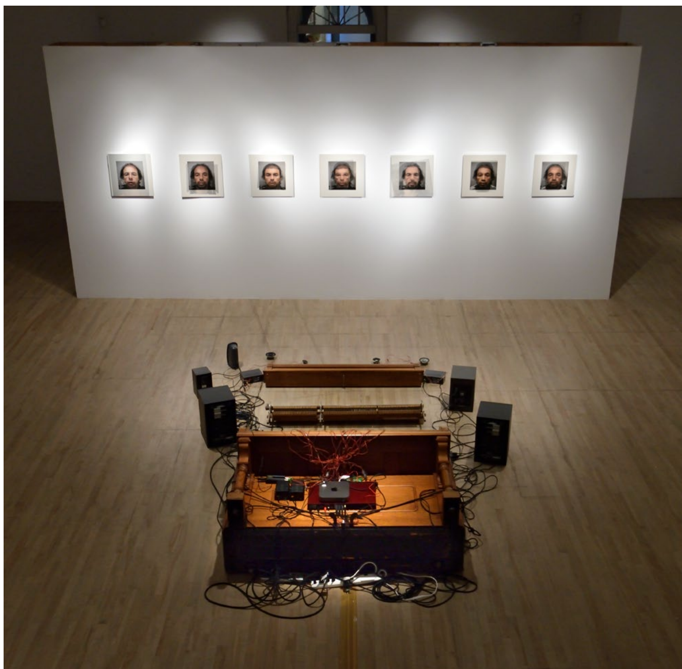
4 Mon père et moi , 2019