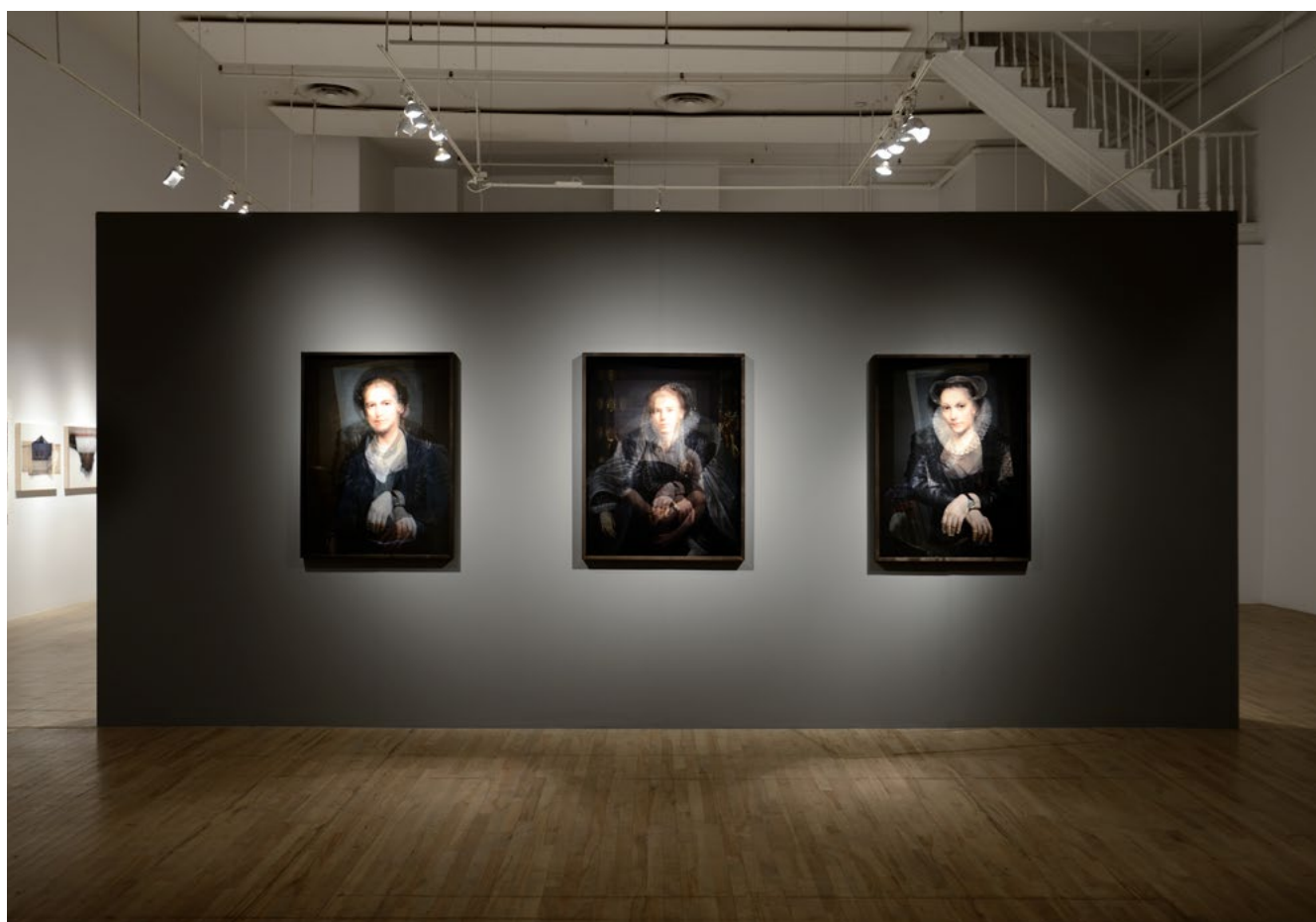
3 Automoiré #6, #1b, #7, 2018

Trois photographies de la série Automoirés recèlent cette même profondeur indicielle qui n'appartient à aucun fait mémoriel, historique ou personnel unique. Une image matricielle se trouve à l'origine de la série : un portrait de l'artiste soumis à la recherche d'images similaires sur Google. Au visage initial s'ajoutent, en voiles opalins, des portraits de grands maîtres de l'histoire de l'art. Produites par l'artiste ou déterminées par la reconnaissance algorithmique, ces images se répondent malgré les temporalités hétérogènes qu'elles convoquent. Elles font surgir les éléments natifs de notre culture visuelle : des postures frontales, protocolaires et des représentations en clair-obscur, tels des « matériaux qui n'en sont pas exactement mais qui servent à construire, des invisibles qui cependant travaillent comme ouvriers à la culture de l'échange 1 ».