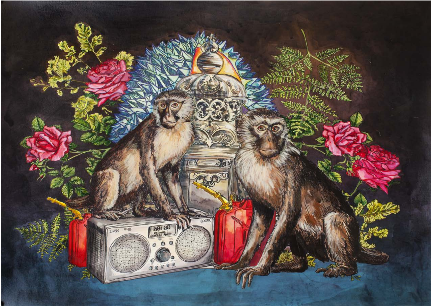
© Cynthia Dinan-Mitchell, Entretiens de fin de soirée , 2017.