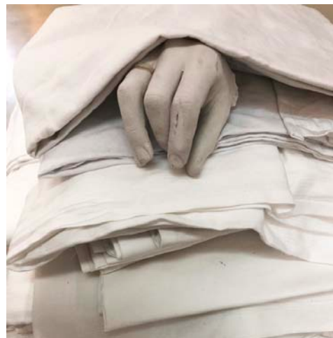
© Giorgia Volpe Ma langue est un sable mouvant (détail), 2018 Travail d'atelier