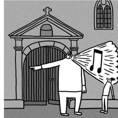
© Diane Obomsawin Le mangeur d'orgues (détail), 2010 Bande dessinée