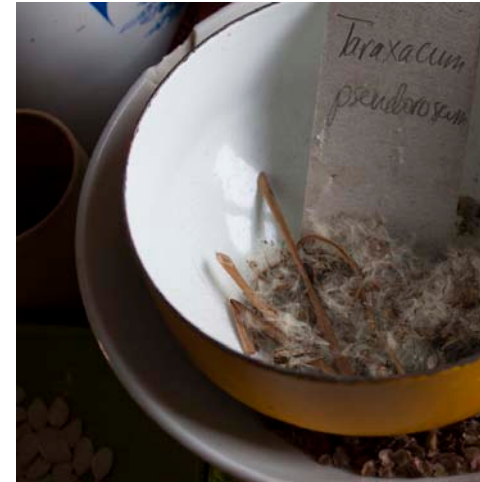
© Andréanne Godin Taraxacum Pseudoroeseum : étude de travail en résidence à la Société des plantes, Kamouraska, 2018